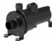
SR-53 PP VAR

mit offenem Mehrschaufelrad mit vorgeschalteter Schneideeinrichtung aus Edelstahl zur Zerkleinerung von Fäkalien mit Fest- und Faserstoffen