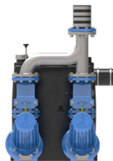
HEBESTAR 420 STD von vorne