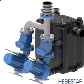
HEBESTAR 420 STD Duplex

Die voll überflutbare Doppelhebeanlage Hebestar 420 STD Duplex ist eine komplett vorinstallierte Fäkalienhebeanlage. Die zwei um 30° angewinkelten Fäkalienpumpen Typ ECO 60 mit einem Korndurchgang von 60 mm fördern Abwasser mit Fäkalien und Feststoffen, wie z.B. Papier, Textilien zuverlässig und energieeffizient. Die hochwertigen Pumpaggregate mit korrosionsfreien Laufrädern sorgen für ein Plus an Betriebssicherheit. Zulaufhöhen von 300 mm sind durch das selbst entlüftende Pumpengehäuse realisierbar. Die Position und die Anzahl der Zuläufe kann entsprechend den örtlichen Gegebenheiten festgelegt werden. Dank dem großen Behältervolumen ist eine DIN-konforme Entwässerung selbst bei sehr langen Druckleitungen gewährleistet und die Anzahl der notwendige Pumpenstarts wird reduziert.