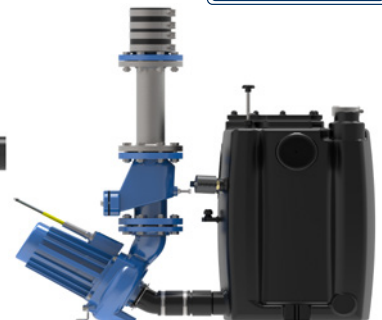
HEBESTAR 420 STD Duplex Seitenansicht